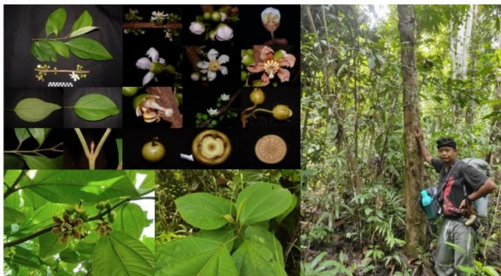
Gambar (Figure) 1. Morfologi B. pentamera (Morphology of B. pentamera )

Penelitian sebelumnya menemukan bahwa distribusi populasi jenis ini berkaitan erat dengan lokasi penebangan liar yang terjadi mulai tahun 2000 hingga 2002 (Dillis, Marshall, & Rejmánek, 2017). Namun demikian, hingga saat ini belum diketahui sebaran dan kelimpahan jenis ini di kawasan TNGP, meski data dan informasi ekologi dasar ini sangat penting dalam pengelolaan jenis asing invasif tersebut. Penelitian ini bertujuan mendapatkan informasi terkait sebaran dan kelimpahan B. pentamera untuk melihat tingkat invasi jenis asing invasif yang berasal dari daerah neotropik ini di kawasan TNGP. Hasil yang diperoleh diharapkan dapat memberikan gambaran invasi B. pentamera di kawasan TNGP dan digunakan sebagai acuan dalam pengelolaan jenis asing invasif oleh pengelola kawasan terutama strategi pengendaliannya.