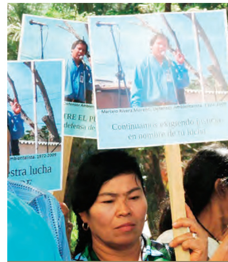
Foto de archivo: Aliados Internacionales contra la Minería en El Salvador.