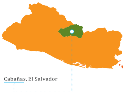
Cabañas, El Salvador