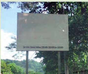
La misma valla publicitaria en blanco después que Pacific Rim fuera adquirida por OceanaGold;