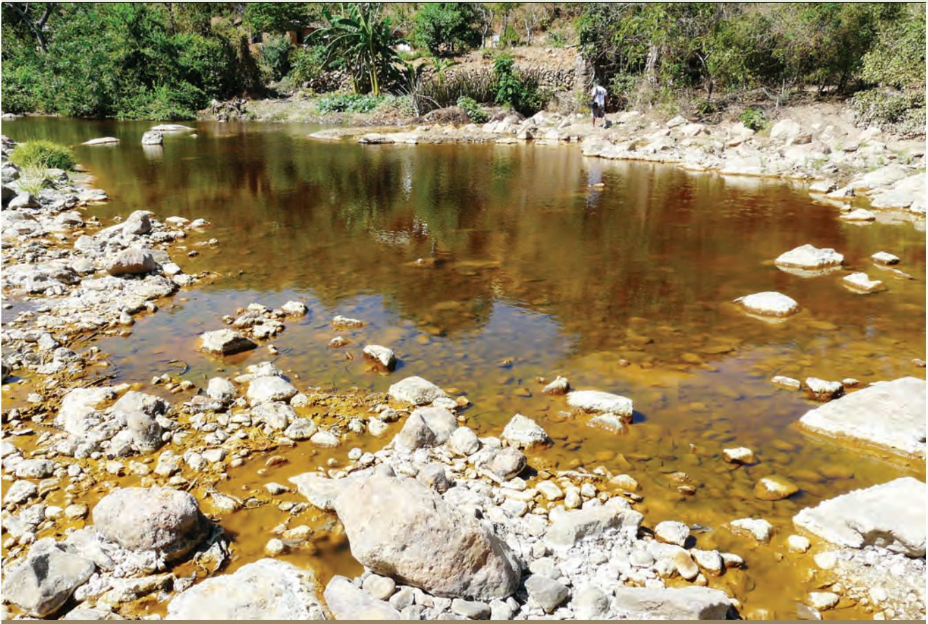
Foto de archivo: Aliados Internacionales contra la Minería en El Salvador.

actividades económicas y sociales locales que no tienen que ver con la minería per se, pero comparten un claro objetivo: que la Fundación El Dorado ayudará a la empresa a obtener un permiso para explotar la mina de oro El Dorado.