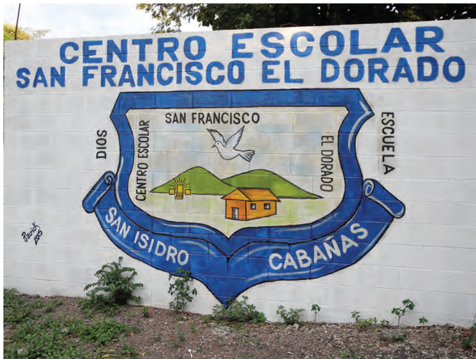
Pared de la escuela en San Isidro, Cabañas.

Algunas personas entrevistadas por el equipo de investigación indicaron también que la fundación deliberadamente ha hecho crecer las expectativas sobre oportunidades de empleo futuras. 39 Por ejemplo, varios entrevistados describieron cómo se hacen correr rumores sobre puestos de trabajo futuros en San Isidro. Esto incluyó invitaciones a registrar nombres en una lista de potenciales candidatos, generando la expectativa de que eventualmente serían contratados por la compañía. 40 Más importante aún, estas oportunidades de empleo se presentan como condicionadas a una