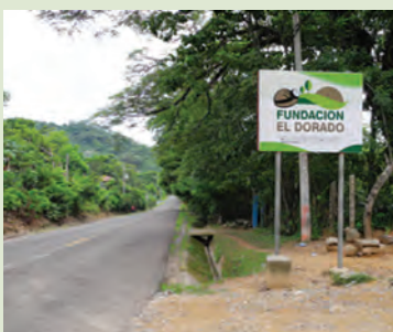
Valla publicitaria de Fundación El Dorado ahora