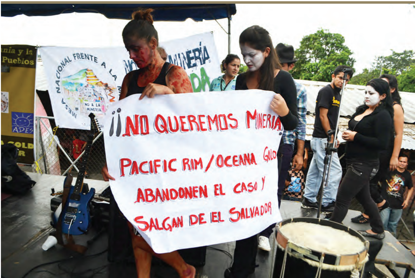
Foto de archivo: Aliados Internacionales contra la Minería en El Salvador.

Finalmente, es importante resaltar que OceanaGold solo invierte en la Fundación El Dorado porque cree que dichas actividades ayudarán a la empresa a obtener un permiso minero. Las consecuencias negativas de estas actividades resaltan la importancia de reconocer la consistente llamada de la sociedad civil salvadoreña, la Iglesia Católica de El Salvador y la Procuraduría para la Defensa de los Derechos Humanos, a prohibir la minería metálica y poner fin al tipo de actividades peligrosas y especulativas en las que OceanaGold se encuentra involucrada.