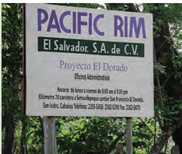
Valla publicitaria de Pacific Rim frente a la entrada de la mina en San Isidro, Cabañas.