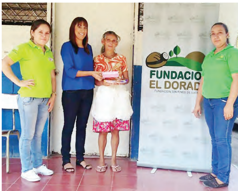
'Historias de éxito: Podemos cuidar la salud de las mujeres'