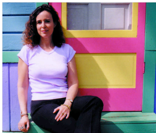
Ruth Behar es Profesora de Antropología en la universidad estadounidense de Michigan. dl

e. gancedo | león 24/10/2011 Tres décadas después de su aparición en Estados Unidos, el Museo Etnográfico de León ultima la publicación —por fin, en español— de The presence of the past in a spanish village ('La presencia del pasado en un pueblo español'), obra pionera por aunar etnografía e historia y que aupó a Ruth Behar —nacida en La Habana y con raíces sefardíes— a la beca Mac Arthur y a una larga ristra de premios, distinciones y publicaciones.