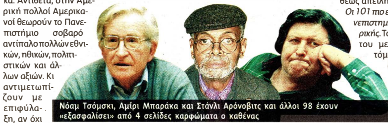
Νόαμ Τσόμσκι, Αμίρι Μπαράκα και Στάνλι Αρόνοβιτς και άλλοι 98 έχουν «εξασφαλίσει» από 4 σελίδες καρφάματα ο καθένας

Ο Βασίλης Λαμπρόπουλος κατέχει την Έδρα Νεοελληνικών Σπουδών Κ. Π. Καβάφη στο Πανεπιστήμιο του Μίσιγκαν